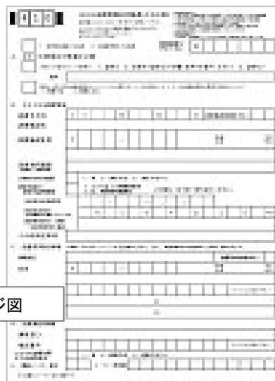
「登録書」イメージ図