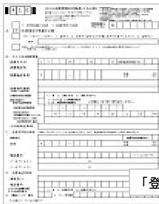
「登録書」イメージ図